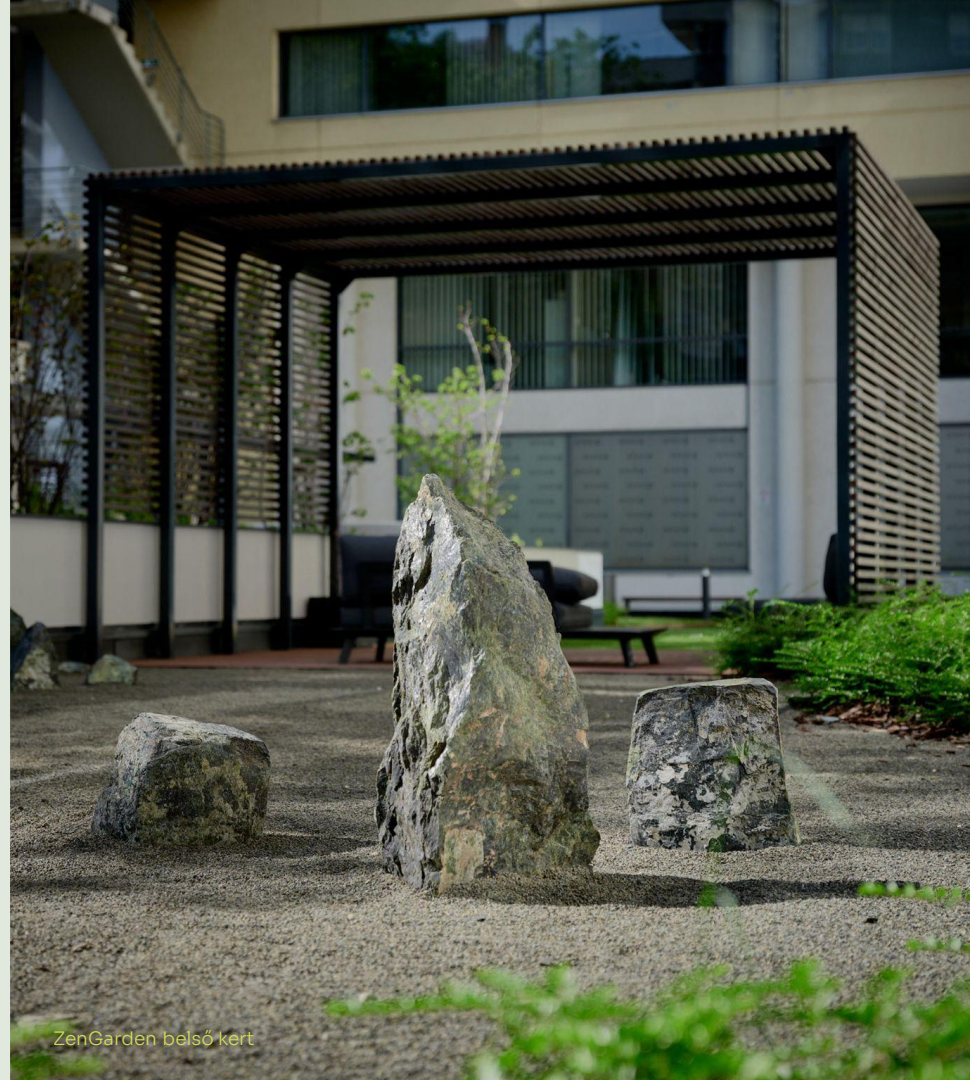
ZenGarden belső kert

Tudatos kockázatkezeléssel és jövőorientált fejlesztésekkel teremtünk fenntartható , hosszú távú értéket kereskedelmi ingatlanportfólióinkban.